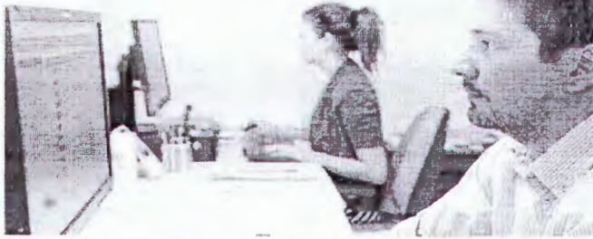
Servidores da Controladoria e Ouvidoria Geral do Estado (CGE), que atende pelo telefone 155. A unidade funciona no Centro de Fortaleza

A ponte entre a empresa e os consumidores, os cidadãos e o Estado, ou ainda, o leitor e os periódicos. O trabalho realizado pelo ouvidor, profissional responsável por essa conexão, é celebrado todo dia 16 de março, desde 2012. Em atenção à data, O POVO trará em cartão no jornal, a partir de abril, fascículos do curso Controle Social na Gestão Pública, uma parceria com a Controladoria e Ouvidoria Geral do Estado (CGE).