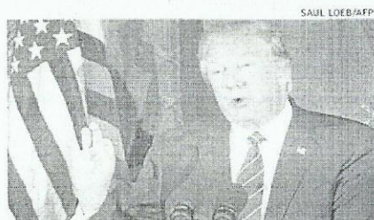
Trump promete levar o caso à Suprema Corte, se necessário