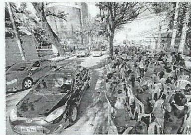
Categoria quer reunião com o prefeito para pedir reajuste