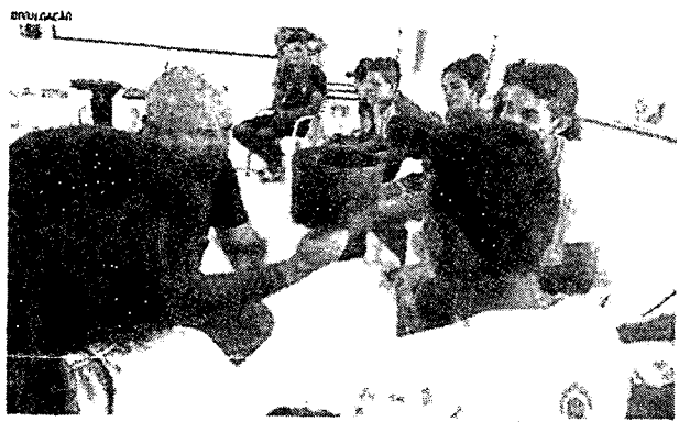
ESTUDANTES iniciam hoje um curso na Casa Amarela Eusébio Oliveira, na UFC

matro próximo a esses jovens, a violência. A produção do filme é uma ótima maneira de retratar este tema', avalia o cineasta. O orientador comenta que os alunos participaram de todas as etapas desde a escolha do roteiro até as fases de produção mais técnicas. 'Eles se transformaram em uma equipe de produção'.