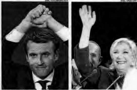
Emmanuel Macron e Marine Le Pen, com programas opostos, disputarão 2º turno na França

O candidato de centro e pró-europeu Emmanuel Macron e sua adversária, a ultradireitista Marine Le Pen, disputarão, em 7 de maio, o 2º turno das eleições presidenciais francesas, nas quais Macron é favorito, após o castigo infligido nas urnas, neste domingo, aos partidos tradicionais. O resultado da primeira rodada é impaciável. É a primeira vez em quase 60 anos que a direita estará ausente do 2º turno e a primeira que não terá representantes dos dois grandes partidos que dominam a política francesa em meio século: os socialistas do presidente François Hollande e os conservadores liderados por François Fillon.