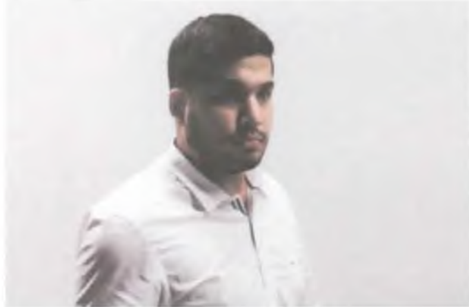
FERNANDES foi condenada a pagar R$ 8 mil em indenização a Nezinho

CARLOS HOLANDA carlos.holanda@povo.com.br