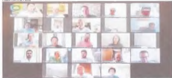
ASSEMBLEIA realizou sessão virtual ontem

A Assembleia Legislativa do Ceará, decidiu, durante sessão deliberativa remota de ontem, 23, aprovar emenda que estabelece que deputados, ex-deputados e servidores da Casa poderão doar, de forma compulsória em folha de pagamento, parte de sua salária a ações de enfrentamento ao novo coronavírus. Os valores doados serão repassados ao Programa Estadual de Incentivo a Doações para a Saúde e ser gerido pela Secretaria Estadual de Saúde (SES).