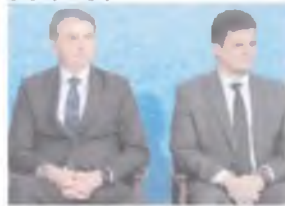
BOLSONARO = Moro: alguém sairia bem chamuscado