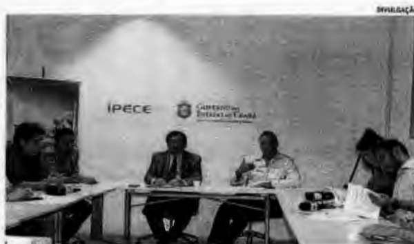
PIB do Estado foi apresentado na tarde de ontem no Ipece

da economia do Estado é ainda a política de Investimento do Governo do Ceará. Em números absolutos, o Estado foi o terceiro que mais investiu no ano passado. Na comparação com a Receita Corrente Líquida, perdeu somente para o Acre. "O que pode impactar (na retomada da economia) é a crise política. A gente observa o início da crise no dia 17 de maio, com denúncia (da JBS) ao Michel Temer (presidente). Esse primeiro trimestre ainda não captou isso. Vamos aguardar o segundo trimestre", diz Nicolino Trompieri, analista de Contas Regionais do Ipece. (BC)