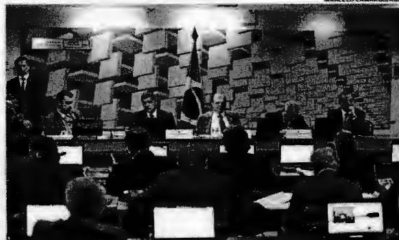
Após 8 horas de sessão, Comissão de Assunto Econômicos aprovou relatório sobre reforma trabalhista

Serão permitidos ainda os contratos em que o trabalho não é contínuo, ou seja, intermitente. O empregador deverá convocar o funcionário com até três dias de antecedência. A remuneração será acordada por hora trabalhada.