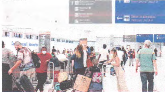
DENTRE AS MEDIDAS no Aeroporto de Fortaleza estão a atenção térmica