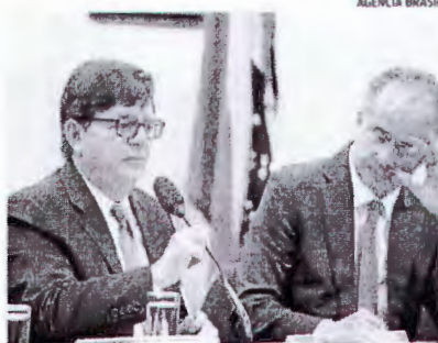
Ministro Herman Benjamin, relator da ação no TSE

O TSE tem jurisdição formada no sentido de que a chapa formada é indivisível e, portanto, a cassação se aplicaria ao cabeça da chapa e ao vice. Nos últimos meses, no entanto, foi costurada uma "engenharia" para livrar Temer da cassação. (Agência Estado)