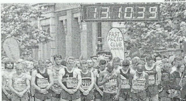
Antes do Great Manchester Run, corredores fizeram um minuto de silêncio em homenagem às vítimas do atentado terrorista. Evento aconteceu enquanto polícia realizava as novas prisões

de mil agentes foram mobilizados para analisar mais de 800 peças de evidência (incluindo 205 documentos digitais) e realizar as operações de busca em 18 lugares diferentes, enquanto cerca de 13 mil horas de imagens de câmeras de segurança foram analisadas. O pai e um dos irmãos do homem-bomba foram presos na Libia. O pai era membro do Grupo Islâmico de Combate Líbio (GICL), que se opunha ao regime do ditador Muammar Kadhafi, derrubado em 2011. Com o avanço da investigação, o nível de alerta ter-