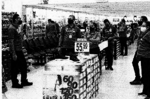
CASA Pia faz liquidações para tentar atrair mais clientes