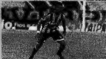
Volta de Raul dará estabilidade à meia cancha do Ceará