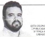
ESTA COLUNA É PUBLICADA EM TERÇA e SÁBADO