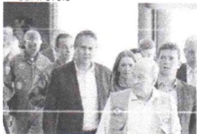
ENTÃO ministro da Defesa, Fernando Azevedo e Silva, em primeiro plano, e atrás dele o governador Camilo Santana e o então ministro Sérgio Moro, durante motim de policiais, em fevereiro de 2020