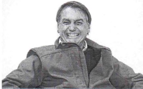
PRESIDENTE pressionou o PL para que não apoie o PSDB em São Paulo

Infraestrutura, Tarciso de Freitas, ao governo paulista. Durante a entrevista, Bolsonaro minimizou as pretensões do ex-presidente Luiz Inácio Lula da Silva (PT) e de Sergio Moro (Podemos) ao Palácio do Planalto. "Não estou preocupado com isso. O povo que escolha o melhor", afirmou. "A grande maioria da população não quer a volta do Lula. A gente vai para debate? Vai. Debate com Lula sem problema nenhum". O presidente voltou a criticar a decisão do Tribunal Superior Eleitoral (TSE) de desmonetizar