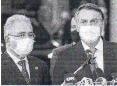
QUEIROGA e Bolsonaro se posicionaram contrários à vacinação de crianças

A ministra Rosa Weber, do Supremo Tribunal Federal (STF), enviou à Procuradoria-Geral da República (PGR) notícia-crime para que o presidente Jair Bolsonaro (PL) e o ministro da Saúde, Marcelo Queiroga, sejam investigados por suposta prevaricação na demora para incluir crianças de cinco a onze anos no programa de imunização contra a Covid-19.