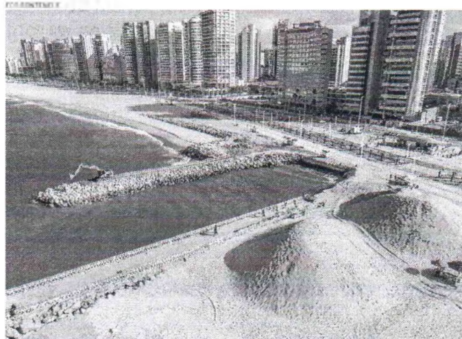
MORRO se forma com a retirada da areia para facilitar a chegada da água da chuva no oceano

| PRAIA DE IRACEMA | Presença de máquinas que fazem os montinhos devem ser menos frequentes após finalização da obra do mini-espigão