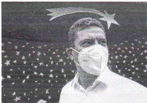
SERGIO Moro durante a passagem por Caucaia

Moro também reagiu à nota divulgada pela Polícia Federal acusando-o de mentir sobre a atuação do órgão e insistiu na tese de que a PF tem esvaziado a apuração de casos de corrupção. Destacando o principal mote de sua campanha, o ex-juiz da Lava Jato ainda criticou o trabalho do Supremo Tribunal Federal e disse que, se eleito, deverá indicar dois ministros "territivelmente contra a corrupção". Segundo Moro, o trabalho do STF tem sido "ruim" e o trabalho do STF tem sido "ruim" e o trabalho do STF tem sido "ruim" e o trabalho do STF tem sido "ruim".