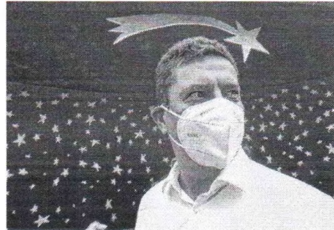
SERGIO Moro durante a passagem por Caucaia

O ex-juiz e pré-candidato a presidente Sergio Moro (Podemos) fez um balanço de suas recentes viagens por estados do Nordeste. Ele afirmou ter sido bem recebido e disse que não percebeu "domínio lulista" na região. Desde a eleição presidencial de 2002, o PT é o mais votado nas eleições presidenciais na região, com destaque para os desempenhos de Lula. Nos estados, o PT também mostra força ao governar estados como Bahia, Rio Grande do Norte, Piauí e Ceará.