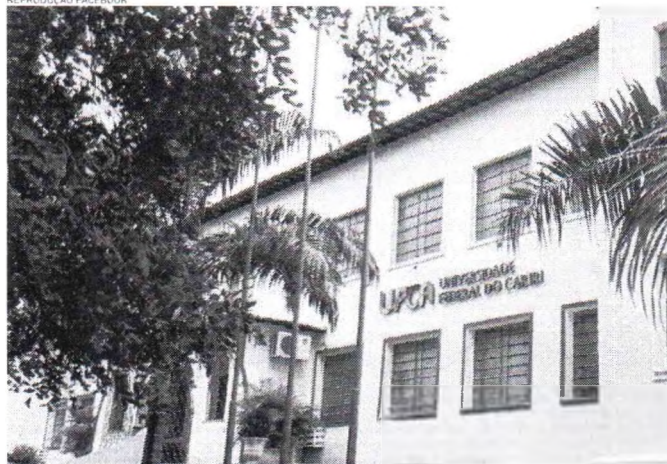
ESTUDANTES entraram no curso de Medicina da Universidade Federal do Ceará (UFCA) por meio de cotas