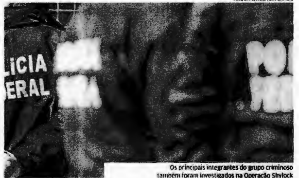
Os principais integrantes do grupo criminoso também foram investigados na Operação Shylock

Um funcionário da Receita Federal, lotado no município de Dinópolis Carqueirana (SC), também é apontado como membro do grupo. Ele