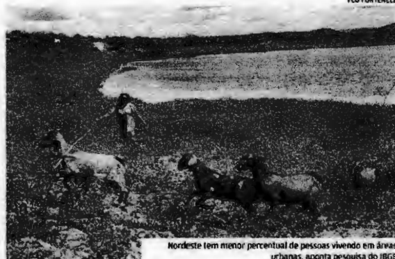
Nordeste tem menor percentual de pessoas vivendo em áreas urbanas, aponta pesquisa do IBGE

A publicação, com base em dados de 2010, propõe uma discussão sobre os critérios até então utilizados na delimitação do território nacional, de forma a aprimorar o Censo Demográfico de 2020, para oferecer à sociedade avanços na diferenciação das áreas rurais e urbanas, de modo a "subsidiar a implementação de políticas públicas e o planejamento em geral no país". Na proposta da nova tipologia a ser utilizada para caracterizar os dois espaços, que adota nova metodologia, a população urbana cai nestes sete anos da data base dos dados utilizados dos 84,4% que vigoravam na metodologia até então utilizada para 76%, concentrados em 26% dos municípios. Já 60,4% dos municípios existentes enquadrados como rurais concentram apenas 17% da população total do país.