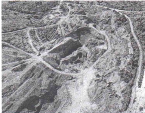
OPERAÇÃO Verde Brasil combateu em 2021 garimpo ilegal em terra indígena em Marabá