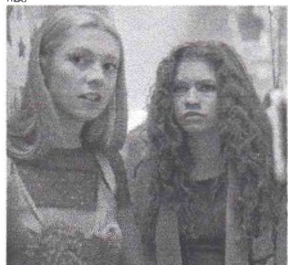
SEGUNDA temporada de 'Euphoria' terminou recentemente