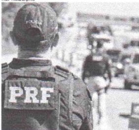
CARNAVAL 2022 registrou menos mortes e acidentes graves