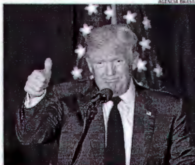
Presidente Donald Trump eleva tom contra Coreia do Norte

"Expressamos o nosso apoio à ideia de que Pyongyang e Seul se envolvam em diálogo e consultas", comentou. Para ele, as tentativas de estrangulamento econômico a Coreia do Norte são "inaceitáveis" e as sanções não irão resolver o problema.