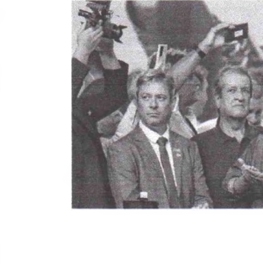
JAIR BOLSONARO participou ontem de um evento do Partido Liberal (PL), em Brasília

lei, a campanha só é permitida a partir de 16 de agosto. O ato ocorreu no mesmo dia em que o PL conseguiu limpar no Tribunal Superior Eleitoral (TSE) para proibir manifestações políticas no festival de música Lollapalooza, após as cantoras Pabllo Vittar e Marina Mayrink serem acusadas de serem transgêneras. “Aquela não é local de fazer campanha para ninguém”, discursou Bolsonaro, em clima de comício. Os organizadores estimaram o público presente em 7 mil pessoas. Há, no entanto, muitos espaços