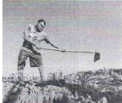
OBJETIVO do projeto é levar desenvolvimento ao interior a partir da influência de cidades-polos

do Desenvolvimento Regional) e vamos identificar quais as necessidades desses pequenos municípios e vamos constituir essa força-tarefa com pessoas com capacidade de resolver os problemas do pequeno produtor."