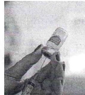
CEARÁ antecipou o início da vacinação contra gripe para tentar barrar casos da doença

FIOCRUZ | Em semanas anteriores, o crescimento acompanhado foi registrado entre crianças. Recentemente, os casos voltaram a crescer entre adultos. Pesquisador ressalta a necessidade de vigilância laboratorial