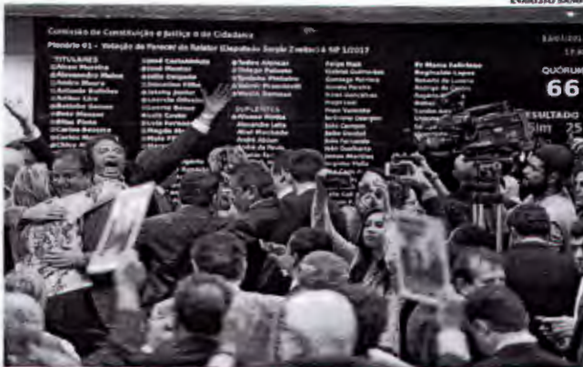
Deputados da base aliada comemoram rejeição de denúncia contra Michel Temer na CCJ da Câmara

Apenas um dos 40 parlamentares que barraram o parecer de Zveiter não teve emendas liberadas desde junho: Maia Filho (PP-PJ), que é suplente. Já os 25 parlamentares que votaram contra Temer receberam cerca de metade desse valor no mesmo período. Foram liberados R$ 135 milhões em emendas dos cofres públicos para os deputados que acreditam haver indícios suficientes para uma investigação contra o presidente.