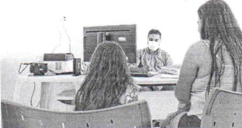
CAPS Infantil atende pacientes com transtornos comportamentais e adoecimentos mentais

Em relação aos atendimentos realizados no antigo espaço, a Prefeitura informou que a