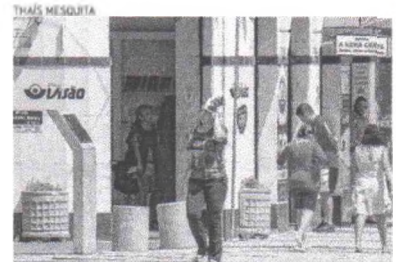
PRE-ESTAÇÃO faz aumentar a umidade do ar e a sensação de calor

Para esta quarta-feira, a Funceme prevê céu variando de nublado a parcialmente nublado em todas as macrorregiões com alta possibilidade de chuva isolada no Ceará no Sertão Central e Irmãos, na faixa litorânea e na Iloroba. Nas demais regiões, há baixa possibilidade de chuva.