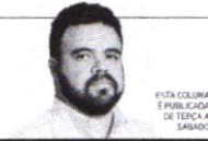
FICHA COLUNA É PUBLICADA DE TERÇA A SABADO