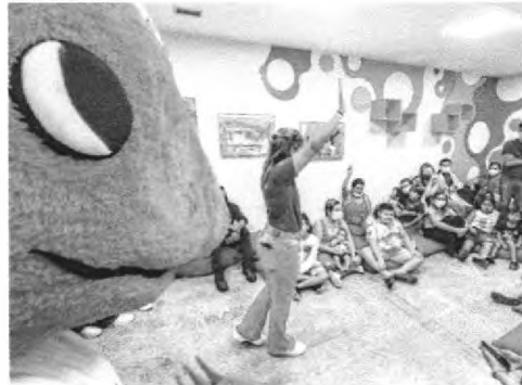
ASSOCIAÇÃO Caatinga usa fantoches para falar sobre a importância de preservar a natureza

CARLOS ENRIQUE CORREIA ESPECIAL PARA O POVO carlos.enrique@povo.com.br