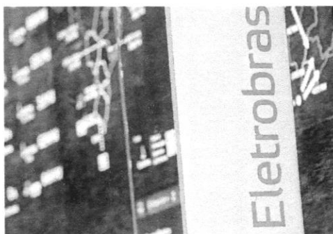
AGU contesta no Supremo parte da lei que privatizou a Eletrobras