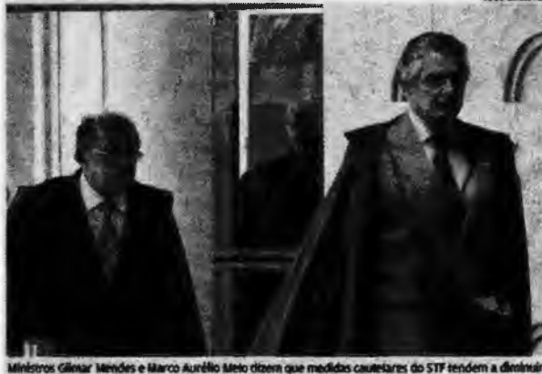
Ministros Gilmar Mendes e Marco Aurélio Mello dizem que medidas cautelares do STF tendem a diminuir

As medidas cautelares, de forma geral, têm a finalidade de interromper um crime em andamento e garantir o sucesso das investigações. O que o STF decidiu é que as medidas que interferem no mandato parlamentar podem ser aplicadas mas precisam passar pelo crivo da casa legisla-