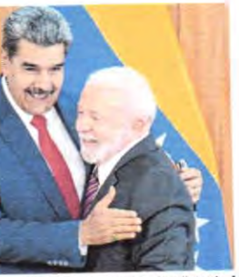
MADURO não visitava o Brasil desde a posse de Dilma Rousseff, em 2015

Ontem, Maduro disse que pretende usar justamente o encontro regional para propor aos