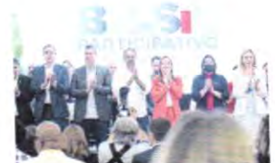
EVENTO na última sexta-feira que reuniu 4 ministros no Ceará