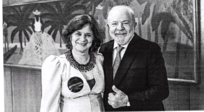
CARGO de Nísia Trindade é alvo de cobiça do Centrão

O presidente Luiz Inácio Lula da Silva (PT) confirmou a permanência da ministra da Saúde, Nísia Trindade, no governo, em meio à vontade do Centrão por mais espaço na Esplanada. Ao elogiar o trabalho da ministra à frente da pasta, ele disse que Nísia pode ficar tranquila sobre a continuidade no cargo.