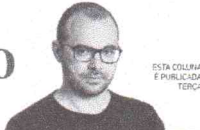
ESTA COLUNA É PUBLICADA TERÇA