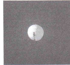
SUPOSTO balão espião chinês no céu sobre Billings, Montana