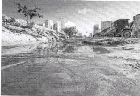
TRECHO da Praia de Iracema precisou de limpeza por causa dos esgotos clandestínos

Endereços com ligações irregulares de esgoto no sistema de drenagem têm dez dias para regularizar a situação. Depois desse prazo, o processo de notificação dos responsáveis dos casos não resolvidos será iniciado pela Agência de Fiscalização de Fortaleza (Agefis). A medida começou a valer na quarta-feira passada, 22.