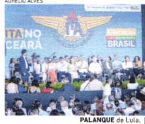
PALANQUE de Lula, sem Luizianne nem Sarto