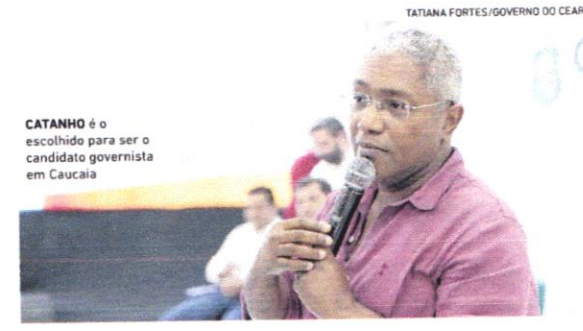
CATANHO é o escolhido para ser o candidato governista em Caucaia

SUPLENTE No Senado, suplentes são eleitos em chapa, votados juntos com o senador