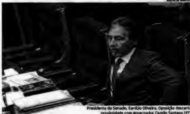
Presidente do Senado, Eunício Oliveira. Oposição descarta proximidade com governador Camilo Santana (PT)

Eleições. As legendas, que formam o maior grupo de oposição no Estado, dizem desconhecer