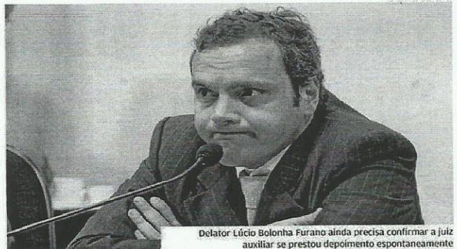
Delator Lúcio Bolonha Furano ainda precisa confirmar a juiz auxiliar se prestou depoimento espontaneamente

Temer foi acusado de corrupção passiva pelo procurador, mas a Câmara rejeitou a denúncia. O presidente, no entanto, ainda é investigado por suspeita de obstrução de Justiça e organização criminosa. A delação de Funaro deve