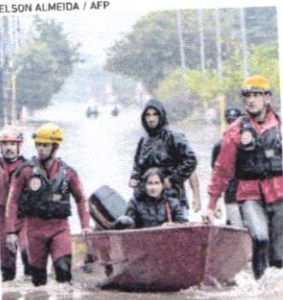
O FIM de semana foi de muitas chuvas no RS