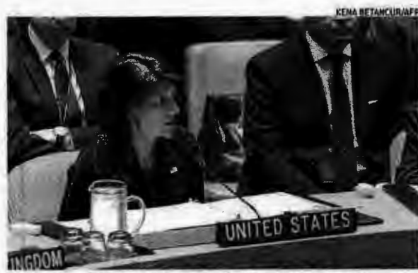
Embaixadora dos EUA na ONU, Nikki Haley, fala que opções do Conselho de Segurança estão esgotadas

Nikki Haley diz que o Conselho de Segurança da ONU não tem chances para conter o programa nuclear da Coreia do Norte e assunto pode ser levado ao Pentágono