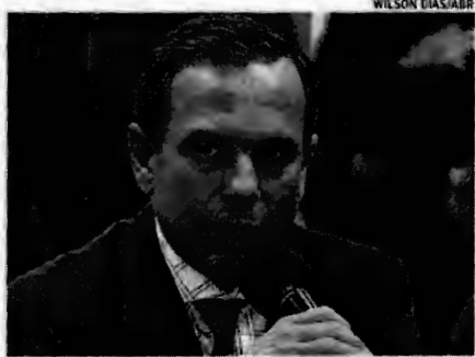
Doria enviou projeto à Câmara que tributa serviços na Internet