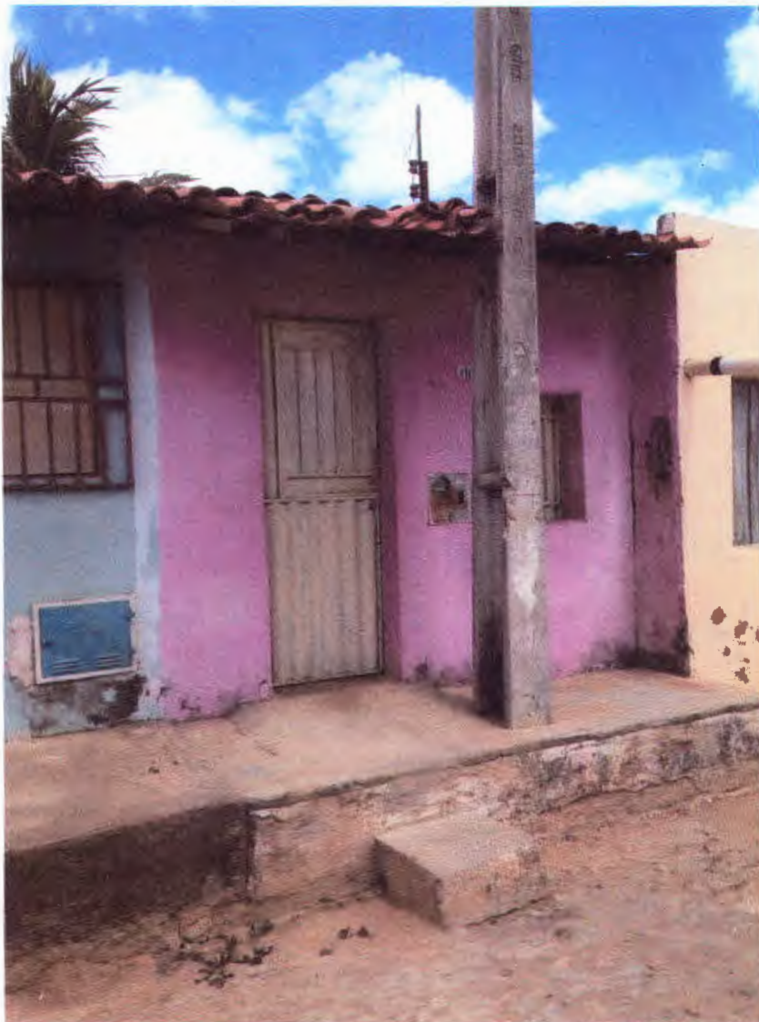
Vista fachada do imóvel avaliando