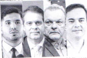
PESQUISA Quaest mostra dois blocos na disputa pela Prefeitura de Fortaleza