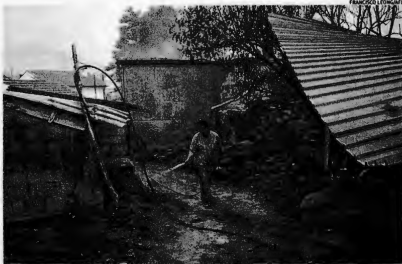
População enfrenta os efeitos do fogo, como acima em Vila Nova, em meio a muitos protestos contra incompetência do governo

Portugal sofreu neste ano os incêndios florestais mais mortais da sua história, que deixaram 64 mortos em junho perto de Pedrógão Grande e 42 mortos e 71 feridos desde domingo, segundo o último balanço da Defesa Civil.