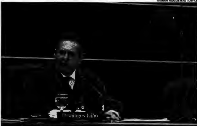
Domingos Filho, ex-presidente do TCM, diz estar "bastante otimista" sobre a votação no STF