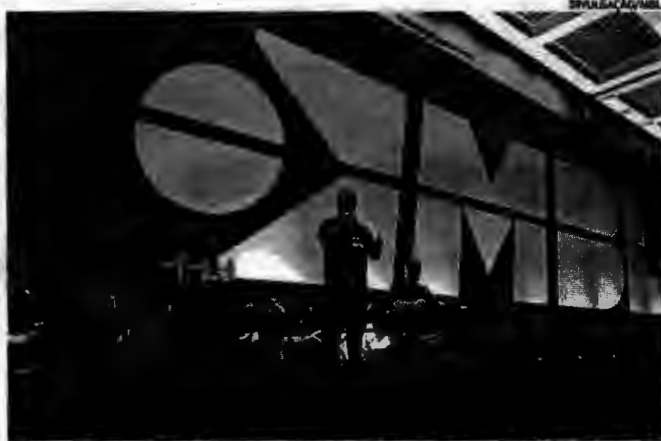
MBL regional, no último fim de semana, congresso que estabeleceu metas para as eleições de 2018